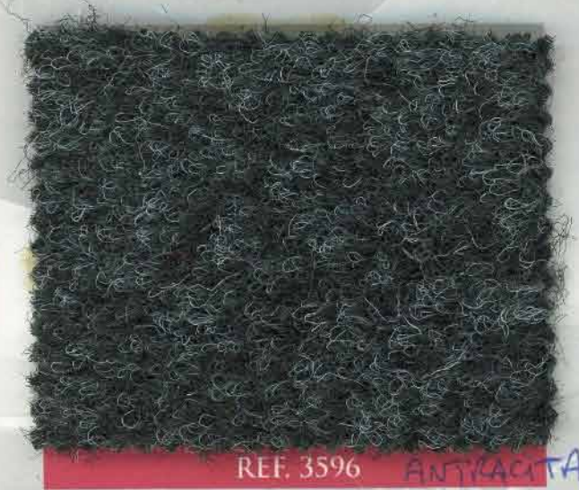
REF. 3596 ANTIACETA